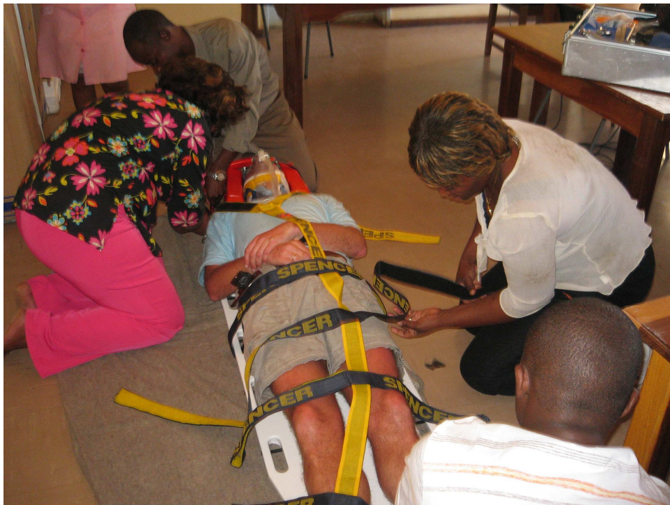
De vier trainers aan het oefenen.

Aan het eind van de middag werden de vier cursisten naar huis gestuurd met een huiswerkopdracht. Er moest een les voorbereid worden, die ze de volgende ochtend voor ons en de groep moesten geven. De les mocht maximaal 30 minuten duren en moest bestaan uit een theoretisch- en een praktisch gedeelte.